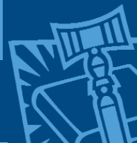
Tabla XIII DICIEMBRE 05 N°13