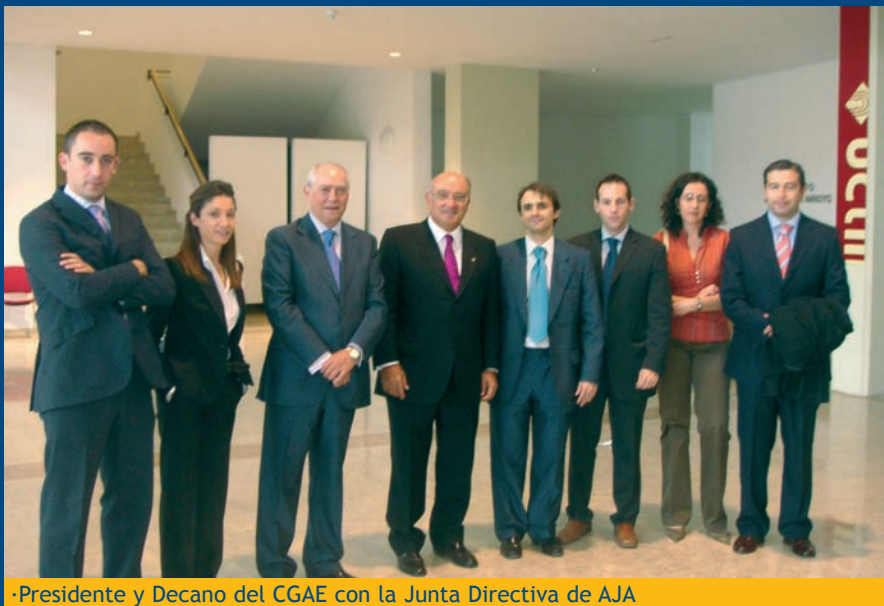
·Presidente y Decano del CGAE con la Junta Directiva de AJA